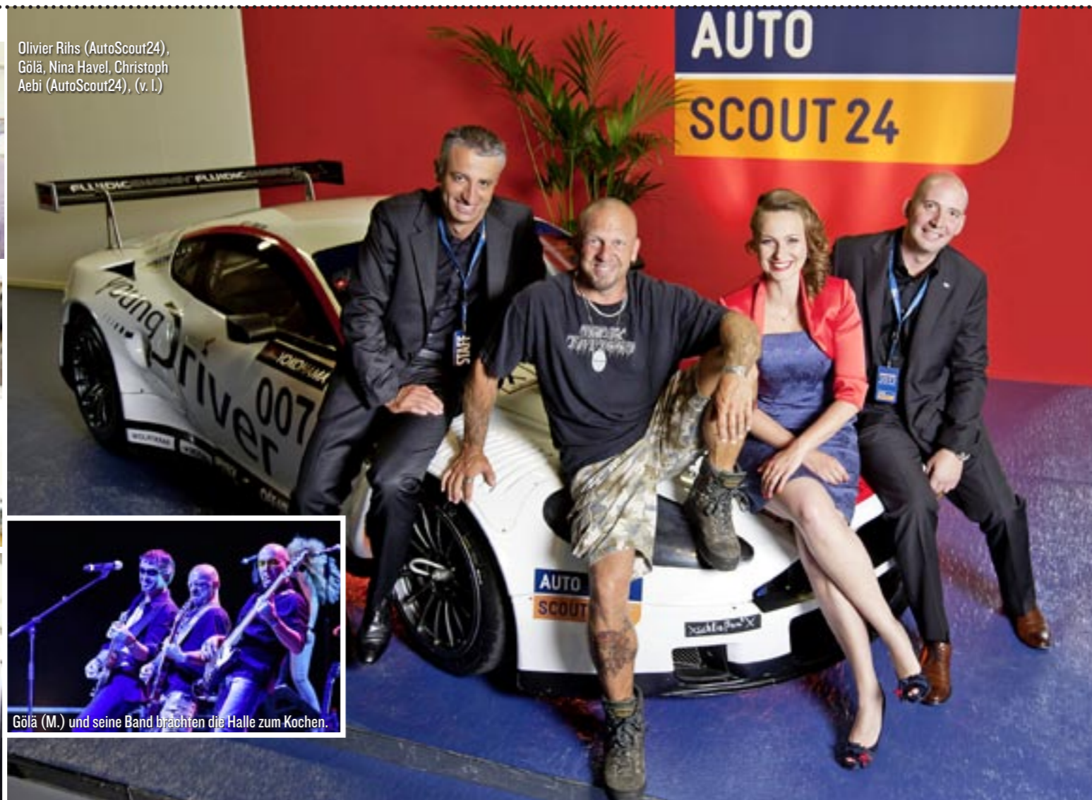
Gölä (M.) und seine Band brachten die Halle zum Kochen.