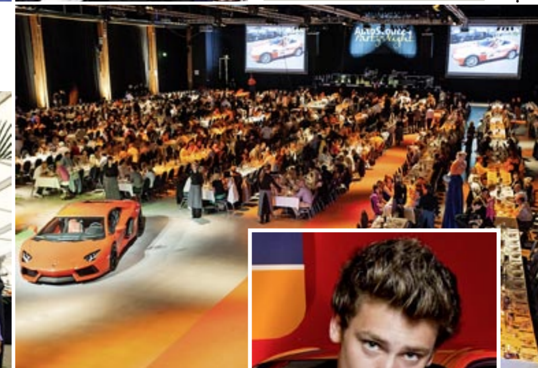
1300 begeisterte Gäste sorgten für eine tolle Stimmung in der Festhalle.